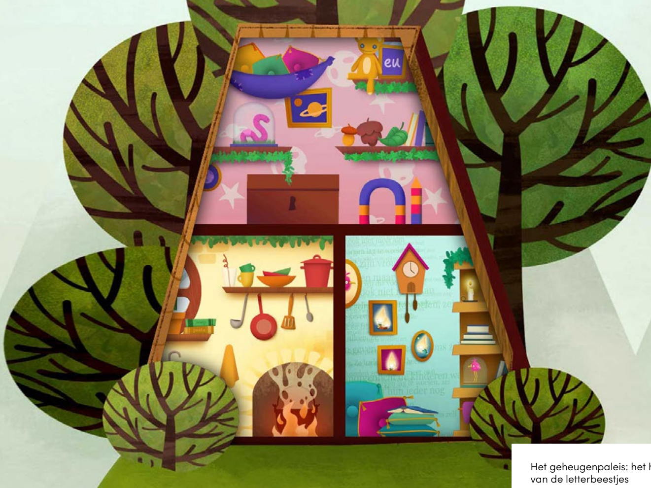
Het geheugenpaleis: het huis van de letterbeestjes

waarin ze de Letterprins helpen zoeken naar de letters die hij is kwijtgeraakt. In de spelomgeving, een spannend kasteel, krijgt de speler verschillende soorten oefeningen aangeboden: letters leren, hardop lezen (foutloos leren lezen), kan deze zin (begrijpend lezen)?, hoort dit erbij (woordbetekenis activeren)?, klopt dit (woordbetekenis leren)?, flitsen. Een speler begint altijd met het aanleren van losse letters. Een ingenieus algoritme zorgt ervoor dat de oefeningen worden afgestemd op het leesniveau van de speler.